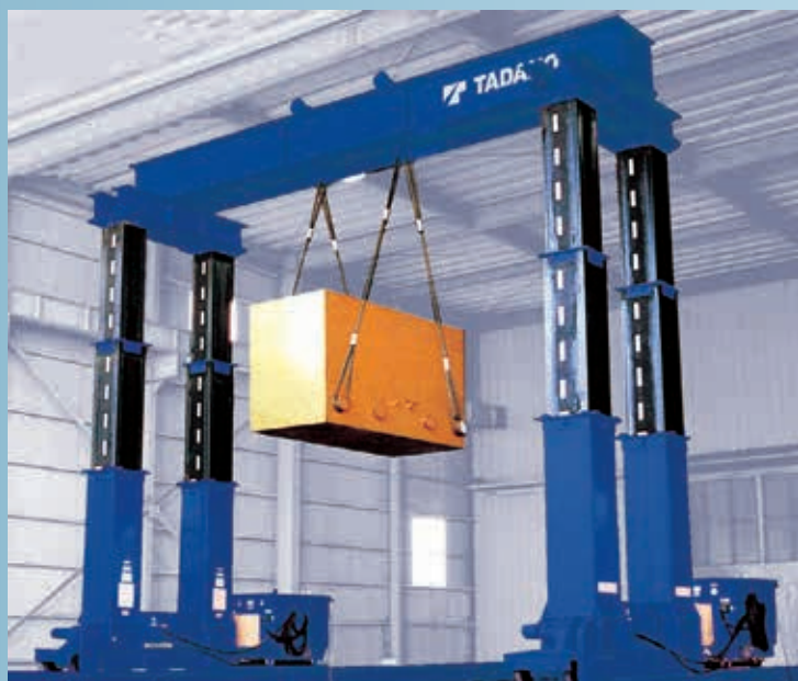
※走行レールはオプション品になります。