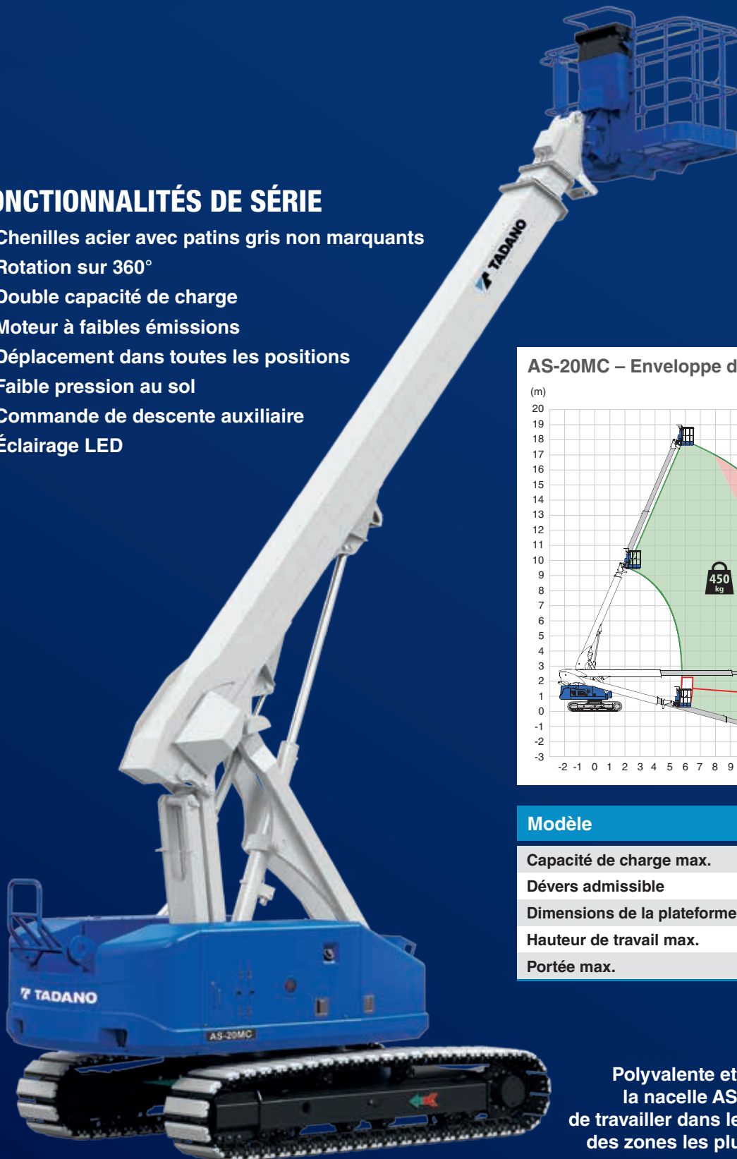
AS-20MC – Enveloppe de travail