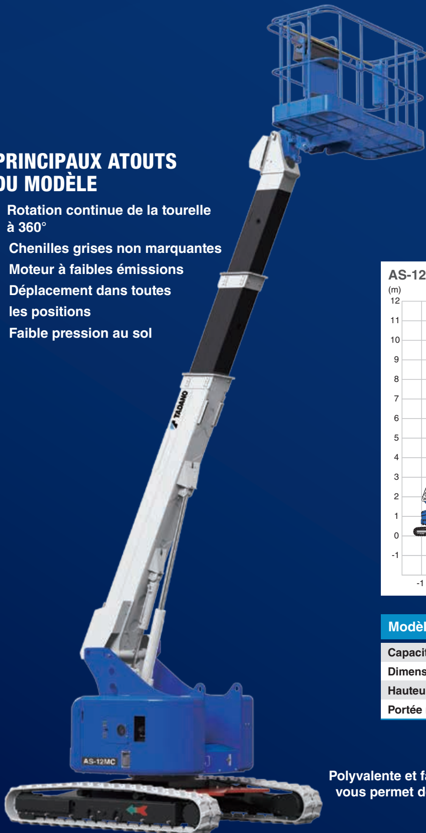
AS-12MC – Plage de mouvements